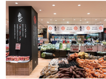
ど鮮度八百屋 まいど

業務スーパー奈良中央卸売市場前店経営と、近畿圏内で青果テナントを展開。「鮮度と価格」を追求、地域のお客様に喜んでいただけるお店を作ります。