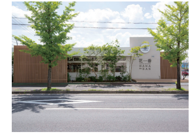
直営飲食店 花一番

手作りにこだわり、旬の野菜をメインとしたお食事を提供する「花一番」を経営。グループ唯一の飲食店として「おいしさ」と「楽しい時間」を提供します。