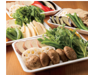
鮮度管理技術を向上させ、商品のロングライフ化を目指します