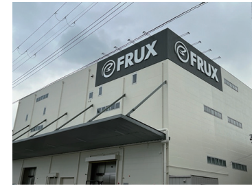
馬司低温流通センター

外食企業、大手給食・機内食会社、惣菜店のキッチンに、ホール野菜から加熱調理品、日配品までの食材をコールドチェーンにて365日お届けします。