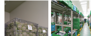
デジタルピッキングを導入