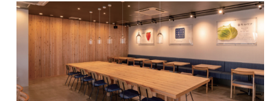
店内は吉野杉を使用した落ち着いた空間