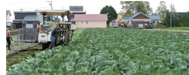
工場向け加工・業務用野菜の調達も行います

手作りにこだわり、旬の野菜をメインとしたお食事を提供する「花一番」を経営。グループ唯一の飲食店として「おいしさ」と「楽しい時間」を提供します。