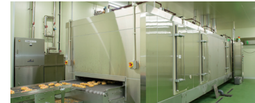
トンネルフリーザーを導入