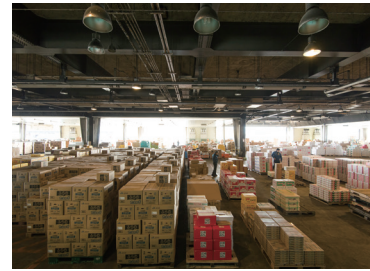
奈良県中央卸売市場にて営業

グループの祖業は仲卸業。卸売市場を介した「プロの目利き」調達、産地契約による安定調達にて厳選青果物を、年間を通して提供。香港への輸出も行います。