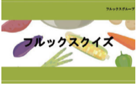
フルックスクイズ