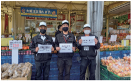
市場前店青果メンバー

恒例となりました社員メッセージ動画をこの春も作成しました。一人ひとりが今年度の目標を掲げ写真を撮影。経営計画発表会にて動画を視聴、当日参加ができない社員はTeamsより視聴しました。