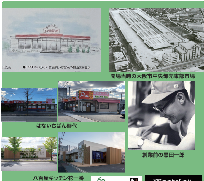
●1993年 初の外食店 餅いちばんや 餅山店を開店