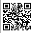
こちらよりご覧いただけます