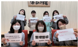
商品開発部メンバー