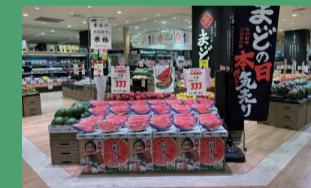
ゾロ目の日はまいどの日、本気売りの日、大創業祭はもっとすごい日になります