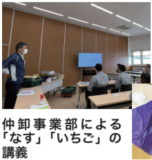
仲卸事業部による「なす」「いちご」の講義