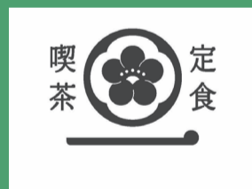
花一番のロゴマーク