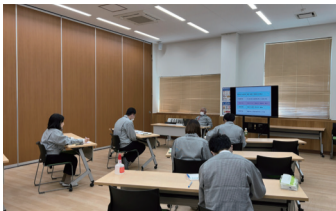
学内ガイダンス参加中

フルックスグループでは、今期約2ヶ月半の新入社員教育を行いました。社員が講師となり行う講義スタイルの研修、工場や店舗の現場研修、社内外のセミナー、社内行事への参加など、新入社員は様々なことを体験中。また今期は、店頭でのキウイ販売や、学内ガイダンスにも参加。ガイダンスでは、学生の皆さんへの会社説明もしてもらいました。出来なかつたことも含めて体験することが、弊社グループの新入社員研修です。たくさんの方の気づきを得る、たくさんの方の社員とコミュニケーションをとることが、これからの仕事に役に立つはず。新入社員の皆さん、フルックススタイルの新入社員研修と一緒に作っていきましょう。