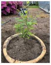
毎年恒例の新入社員による植樹では、大和橋を植えました