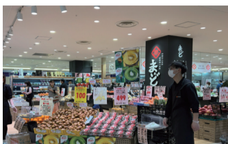
キウイの試食販売にチャレンジ