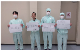
池沢工場メンバー